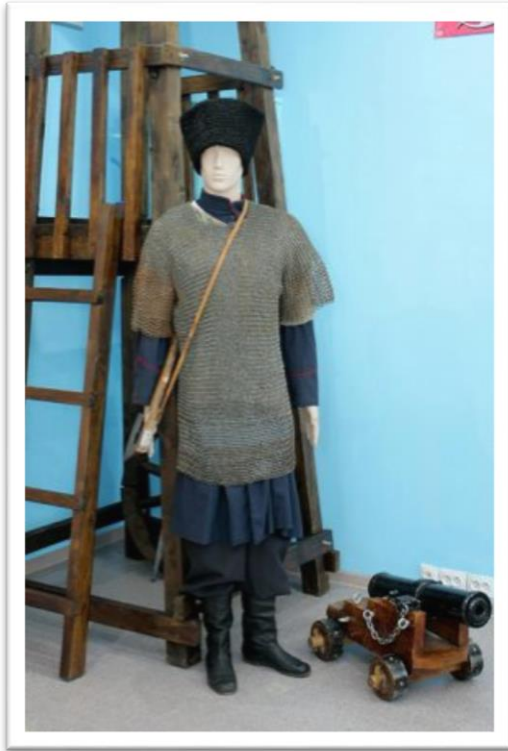
Казак дружины Ермака времен Ивана Грозного